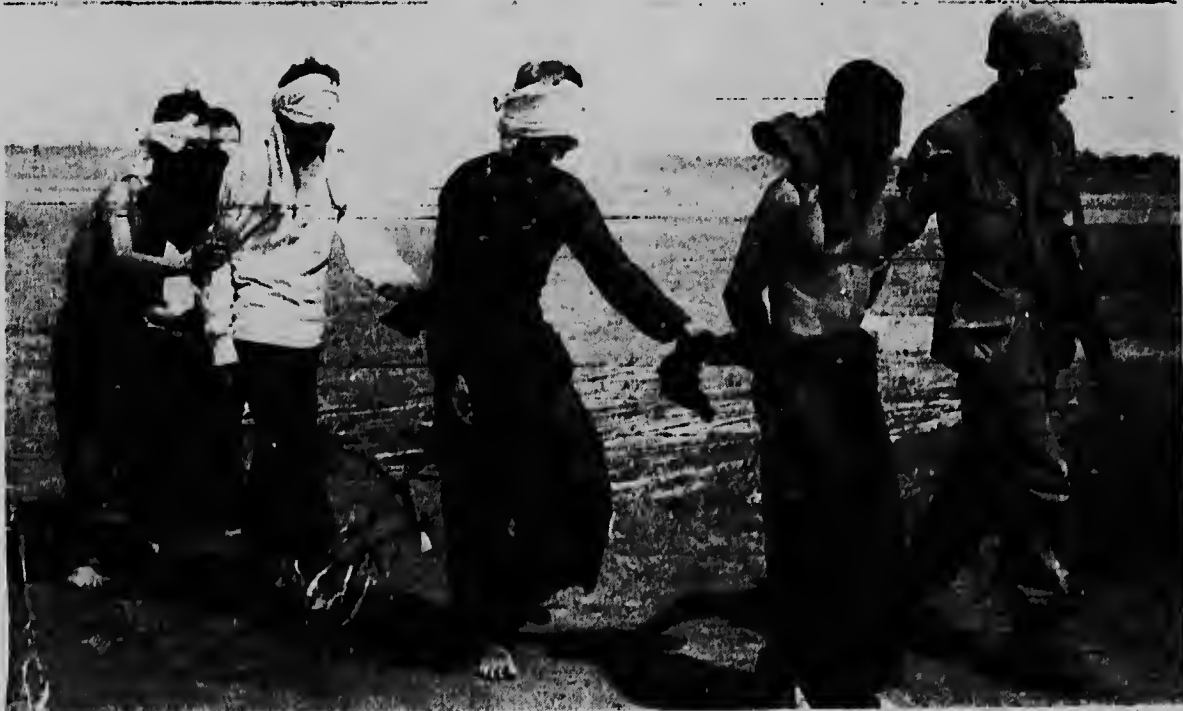
Y sigue la guerra....Un soldá mericano aki ta conduciendo un grupo di guerrilleronan Vietcong qu ei a captura den Delta di Mekong ayera mientras qu pa guia otro, nan tin qu tene otro su man serrá, pa-sobra nan wowo ta tapá.

E asalto a tuma lugar den caya di un barrio residencial tranquil di Roma mientres cu mayoria parti di e efectivonan policial tabata investiga un misterio gran di na Castegandolfo, cas na unda Papa sa pasa un cierto periodo di anja.